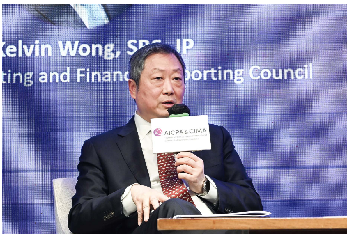
主席黃天祐博士於英國特許管理會計師公會的年會上發表對良好管治的見解。

2023年11月20日，英國特許管理會計師公會邀請主席黃天祐博士在其年會上發表演講，年會主題為「綠色成長與管治」。約200名商業領袖、專業人士和財務高層出席了此次年會。黃博士透過生動有趣的簡報，就良好管治、管治失敗的原因以及會計師在捍衛管治方面的角色分享他的看法和見解。