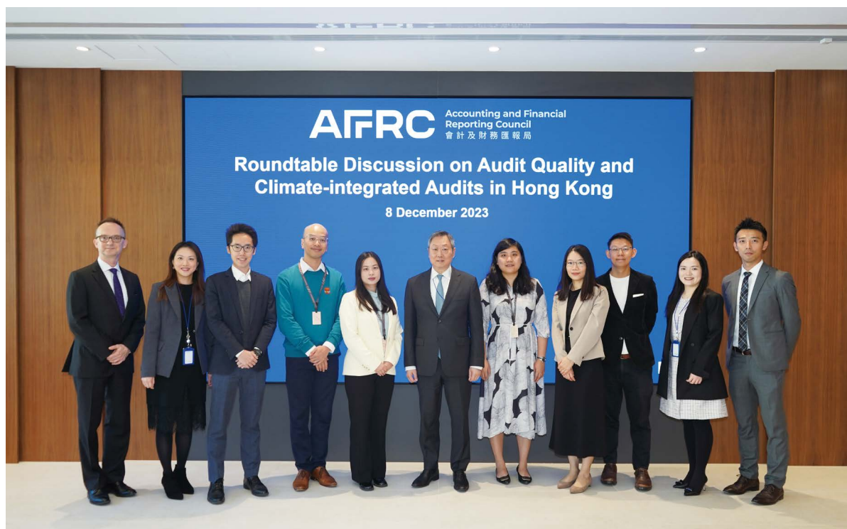
會財局與機構投資者、審計委員會成員和公眾利益實體核數師舉行了三場圓桌討論。

在與審計委員會的討論中，與會者表達了對核數師展示其價值觀的期望，特別是在確保高質素審計方面。