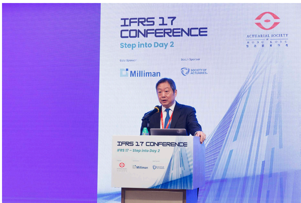
主席黃天祐博士在香港精算學會主辦的《國際財務報告準則第17號》會議上發表主題演講。

2023年10月25日，會財局主席黃天祐博士應邀在香港精算學會主辦的《國際財務報告準則第17號》會議上發表 主題演講 。黃博士向與會者分享會財局的轉化歷程，會財局與本地、內地及國際監管機構就維護香港資本市場誠信而進行的策略合作，以及精算師面臨的挑戰和機遇。